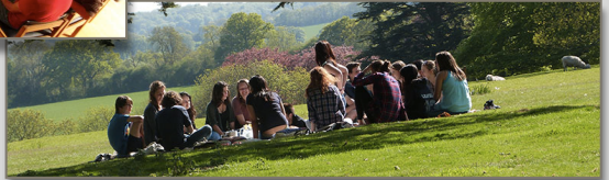
Krishnamurti Brockwood Park School

Boeken zijn wel belangrijk, maar wat nog veel belangrijker is, is je eigen boek, je eigen verhaal te leren lezen.