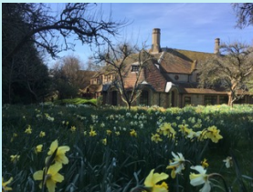
K-Centre, Brockwood Park

Uit: 'Waar zijn we in hemelsnaam mee bezig?' London, 1st public talk, 5 June 1962