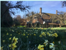
K-Centre, Brockwood Park