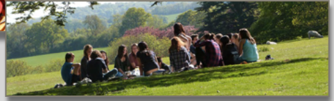
Krishnamurti Brockwood Park School

Vraag: Is er iets dat je kunt doen om besef te hebben?