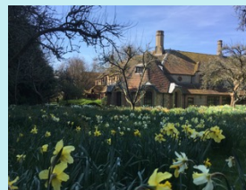
K-Centre, Brockwood Park

De manier waarop we nu leven, de manier waarop we lesgeven, waarop onze regeringen worden geleid, met hun corruptie en hun aanhoudende oorlogen – noemen jullie dat praktisch? Is ambitie praktisch? Is hebzucht praktisch? Ambitie leidt tot concurrentie en maakt daarmee mensen kapot. Een maatschappij die op hebzucht en inhaligheid berust, draagt altijd het schrikbeeld van oorlog, conflicten en leed in zich. En is dat praktisch? Vanzelfsprekend niet. Dat is wat ik jullie probeer te vertellen in al deze verschillende gesprekken.”