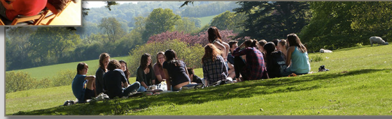
Krishnamurti Brockwood Park School

Weet je, ontdekken wat we graag willen doen, is een van de moeilijkste dingen, niet alleen als we nog bezig zijn volwassen te worden, maar ons hele leven lang. En als je niet zelf ontdekt wat je echt van ganser harte wilt doen, zal het ermee eindigen dat je iets gaat doen wat niet echt van essentieel belang voor je is en een ellendig leven leiden. En doordat je je ellendig voelt, zal je afleiding zoeken in bioscoop, in drank, in het lezen van talloze boeken, enz... Kan een leraar je nu helpen te ontdekken wat het is dat je graag je leven lang zou willen doen, ongeacht wat je ouders en de maatschappij zouden willen dat je deed? Dat is de vraag waar het echt om gaat, niet?